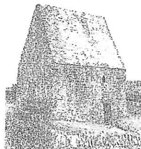
Vormittelalterliche Kirchen von Assyrien bis zu den Inseln von Nordwest-Europa

Die Anfänge einer Christifikation der Welt durch das Wort der Predigt Gottes