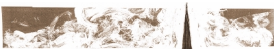
ZU REKONSTRUIERENDER ZUSTAND DER WESTFASSADE